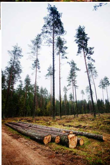
Marken i skogen, som sedan 1979 står med på Unescos lista över världsarv, är täckt av mossa, svampar och ihåliga och förmultnade träd.

borttransporteras. Hade det varit ett vanligt skogsdistrikt säger reglerna att smittade träd måste flyttas minst tre kilometer från skogen, annars riskerar granbarkborren att sprida sig. Eftersom bilagan med de nya kvoterna inte börjat att gälla ännu lämnas samtliga träd kvar, vilket främjar smittspridningen.