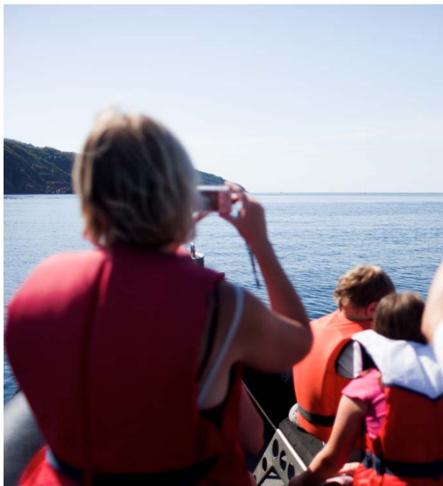
Hel safari. Havsbisen bjuder på svalka i den annars tryckande hetten. För att bidra till forskningen rapporteras alla observationer