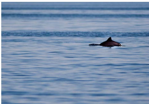
Tumlarna är lätta att känna igen på sin tumlande rörelse genom vattnet – som en delfin i slow motion.