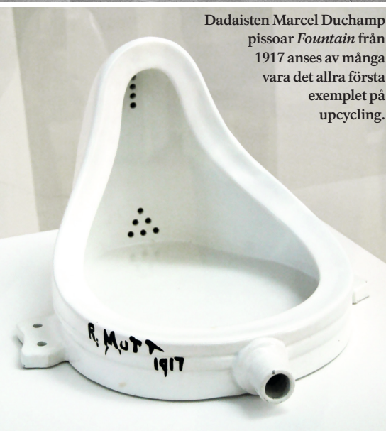
Dadaisten Marcel Duchamp pissoar Fountain från 1917 anses av många vara det allra första exemplet på upcycling.