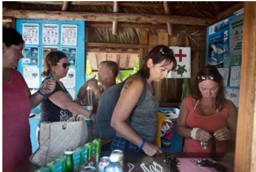
Attraksjon Turister besøker bevaringssenteret og lærer om arbeidet som drives for å verne skilpaddene. Senteret driver også med kursing for kubanske skoleelever.