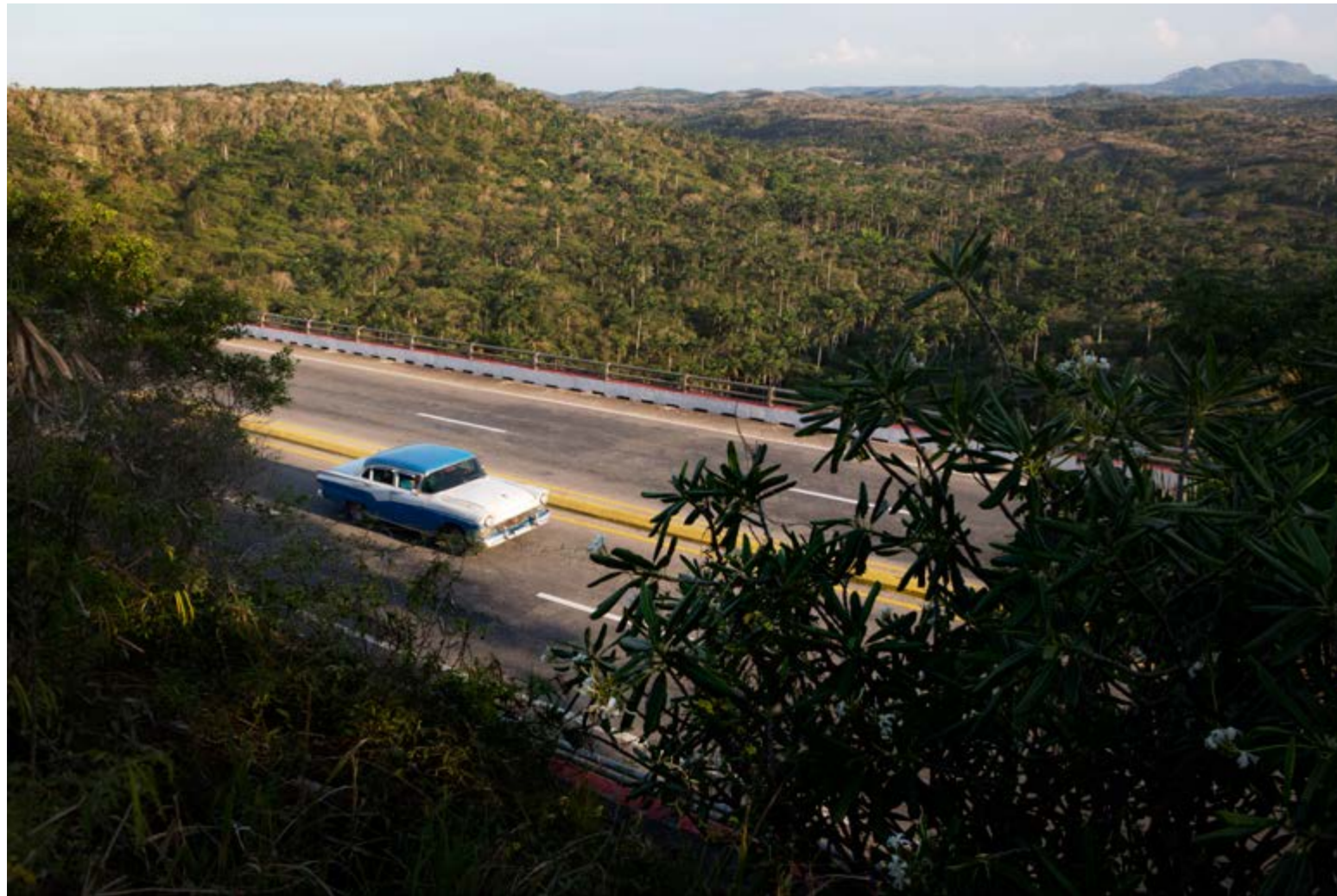
Humberto Rios Labrada ser at den største utfordring er å finne en balanse mellom den biodynamiske Kuba som oppstått og en ny åpenhet mot USA og reduserte embargoer