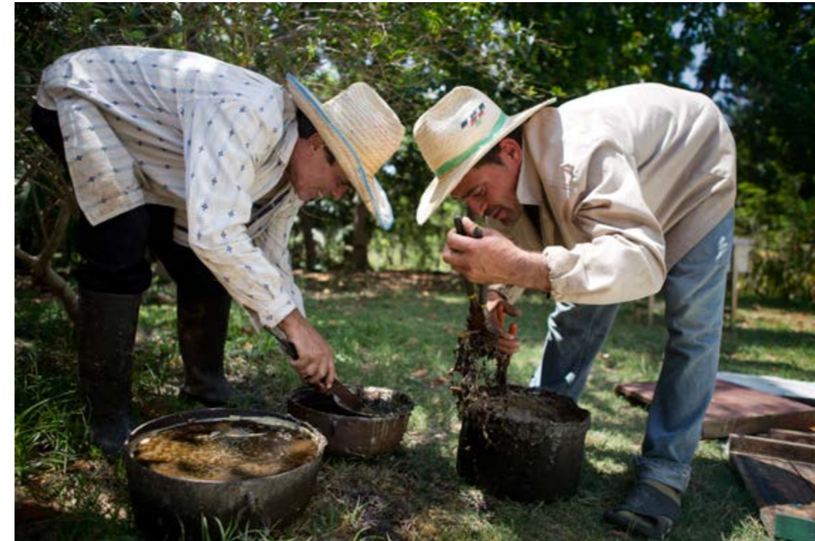
De inhemske kubanske bina Melipona på gården Finca Marta.

– Hele livet er fullt av farer og muligheter – det handler om å tilpasse seg og prioritere. Jeg bekymrer meg ikke for fremtiden, jeg har mer enn nok her og nå.